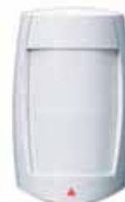
Digitális Dual-optikás csúcsmínőségû PIR (40kg/90lb valódi kisállat tûrés) (MG-PMD75) Hatótáv: 35m (115ft)*