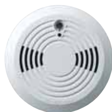
Füstérzékelő (SD738) Hatótáv: 30m (100ft)* Gyártja: EVERDAQ (Taiwan)†