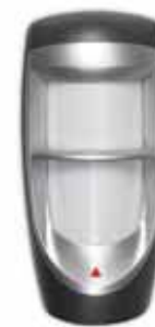
Digitális Dual-optikás csúcsmínőségû kültéri PIR (40kg/90lb valódi kisállat tûrés) (MG-PMD85) Hatótáv: 35m (115ft)*

* normál lakás környezetben † gyártó és kizárólagos forgalmazó: EVERDAQ Technology Co. Ltd.