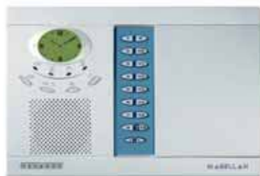
Kombinált rádiós rendszer (MG-6060)