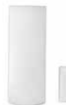
Nagyhatótávolságú nyitásérzékelő (MG-DCT1) Hatótáv: 35m (115ft)*